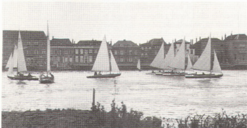
Start van de "Kampereiland-race" voor restaurant "De Kamper Bar" (het huidige rest. "De IJssel").

Een wedstrijd voor waaghalzen werd ie genoemd. Je moest namelijk zee op. We zeggen zee, maar dat was het dan ook: de Noord-Oost polder was er, maar Oostelijk Flevoland en de dijk naar Enkhuizen lagen er nog niet in de door de Afsluitdijk afgesloten Zuiderzee. Kunt u zich voorstellen wat een rollers er liepen bij een noordwesten wind! Die kwamen rechtstreeks van Hoorn af.