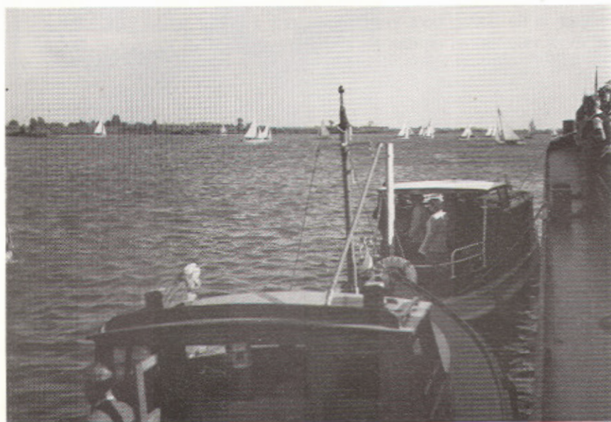
Startschip 'Rea' van Hennephof met daarachter de vleet van Meijer.

Dat lag vroeger iets anders. Kajuitboten bestonden nauwelijks in deze regio, laat staan motorboten. Het was 'open' boten wat de klok sloeg. Om er wat te noemen: 16 kwadraten waren er veel, de vergrootte BM werd hij ook wel genoemd. Een paar regenbogen, want daar had je toen al wat geld voor nodig. Larken, die platte dingen; 22 kwadraten, sharpies, valken en 12 voets jollen. En dan natuurlijk een bonte mengeling van eigen ontwerpen en bouwsels, die zo af en toe nog vrij snel waren, completeerden de vloot van open zeilboten in het stroomgebied van IJssel, Ganzediep en ver daarbuiten.