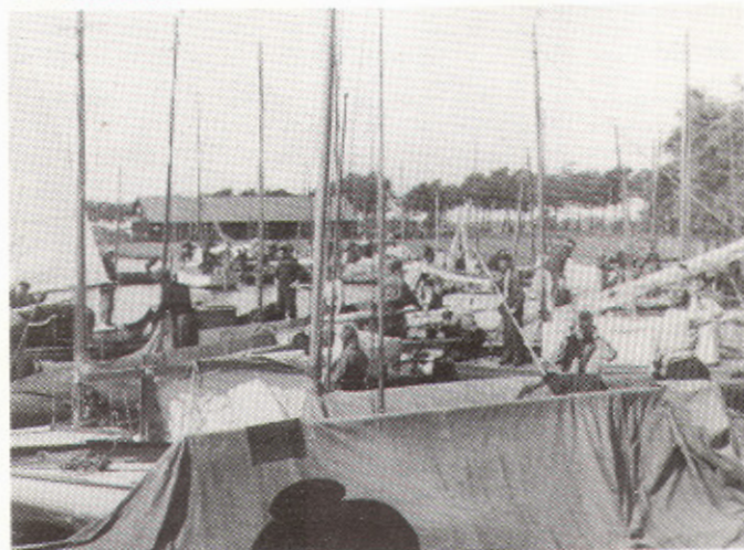
Bij "Heite", 10 juni 1946. Gereed voor de terugreis.

Niet alleen Zwartsluis was een vaste 'buitenlandse' pleisterplaats, Giethoorn of eigenlijk 'de Blauwe Hand' was dat ook, daar was het café van Heite.