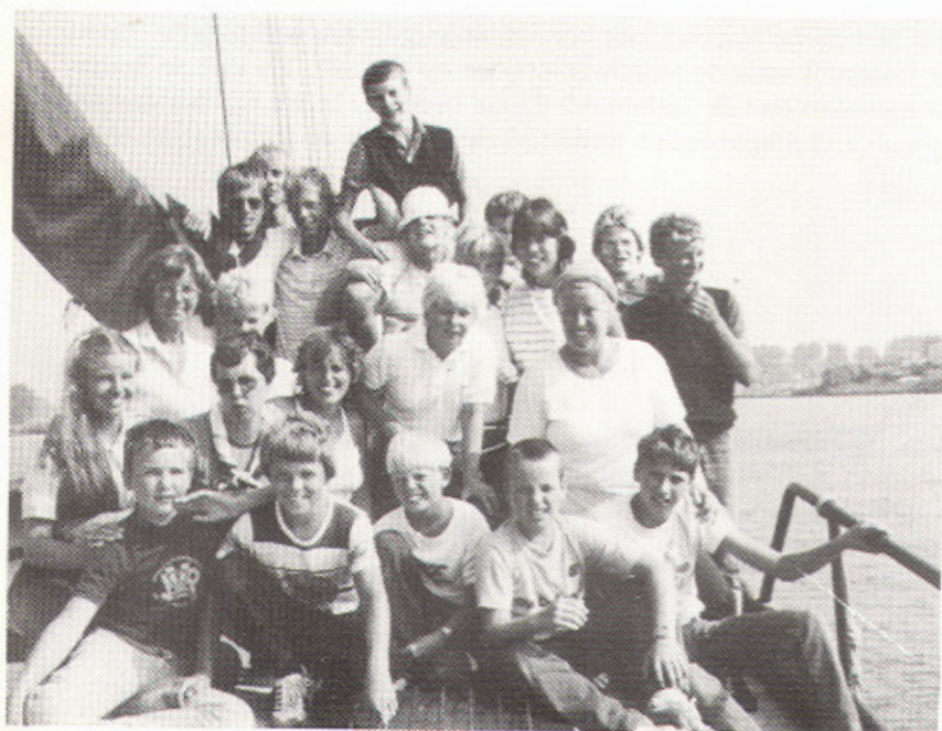
Nog een andere jeugdactiviteit: Klippertochten over IJsselmeer en Wadden.

We geloven dat er nergens in Nederland een haven met daaraan verbonden, zo'n mooie kolk is, waar jeugd, die nog niet ervaren genoeg is voor het grote water, de zeilsport zo veilig en beschut onder de knie kan krijgen. Kinderen die onder het toezien van de ouders zich in en op het water zich meestal kostelijk vermaken met zwemmen, surfen en vooral zeilen.