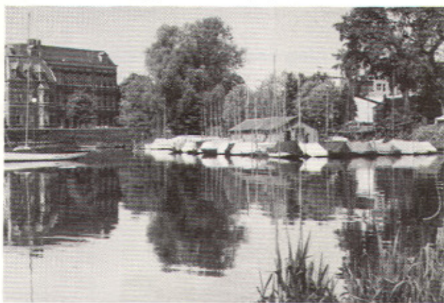
Bovenhaven met botenhuis in de jaren '40.