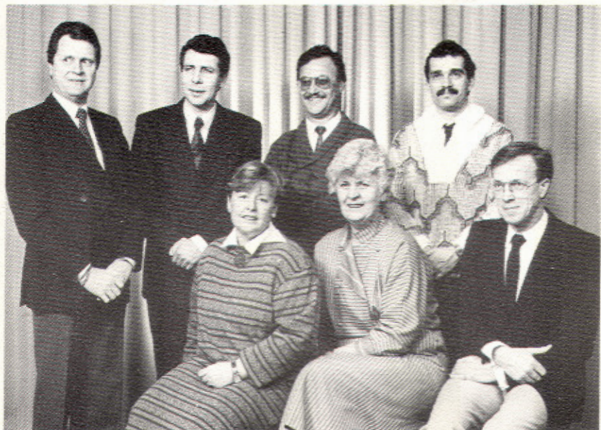
Het bestuur van ZC'37 in het jubileumjaar 1987.